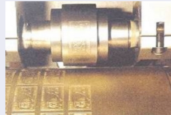
Molette beim Einrichten