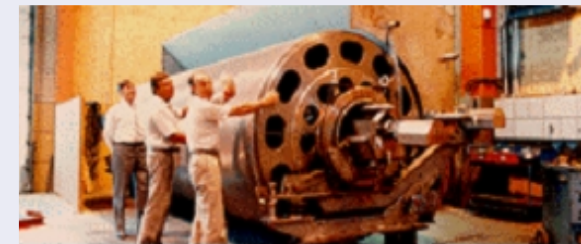
Egoutteur im Größenvergleich